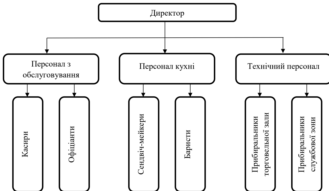
Рисунок 1.1 – Організаційна структура управління кав'ярні-пекарні «Франсуа»