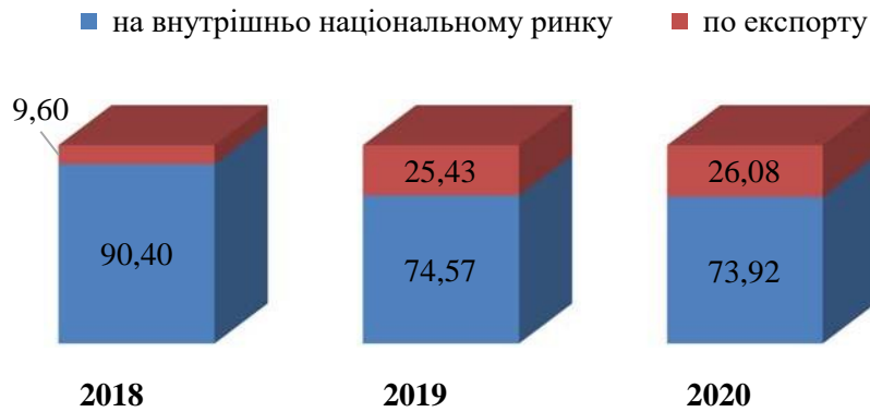
Рисунок 2.5 – Структура реалізованої продукції ТОВ СП «МЕД ПОДІЛЛЯ» за напрямками продажу у 2018-2020 рр., % [8]

Структура реалізованої продукції ТОВ СП «МЕД ПОДІЛЛЯ» за напрямками продажу у 2018-2020 рр. наведена на рис. 2.5.