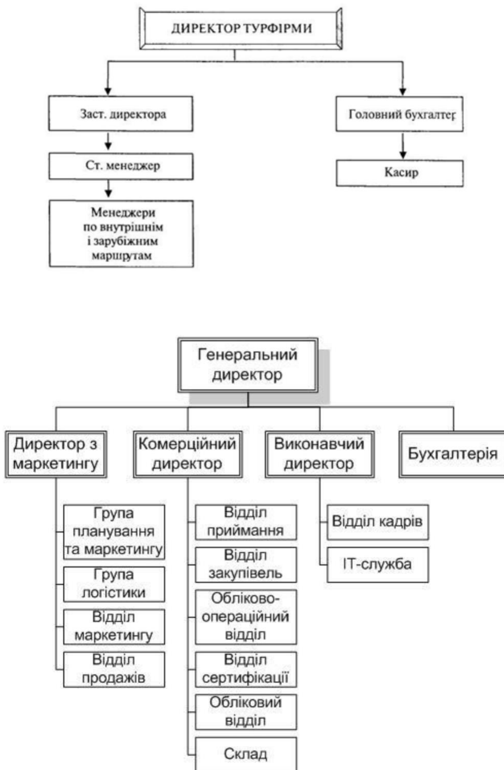
Рисунок 2.1 – Організаційна структура управління підприємством