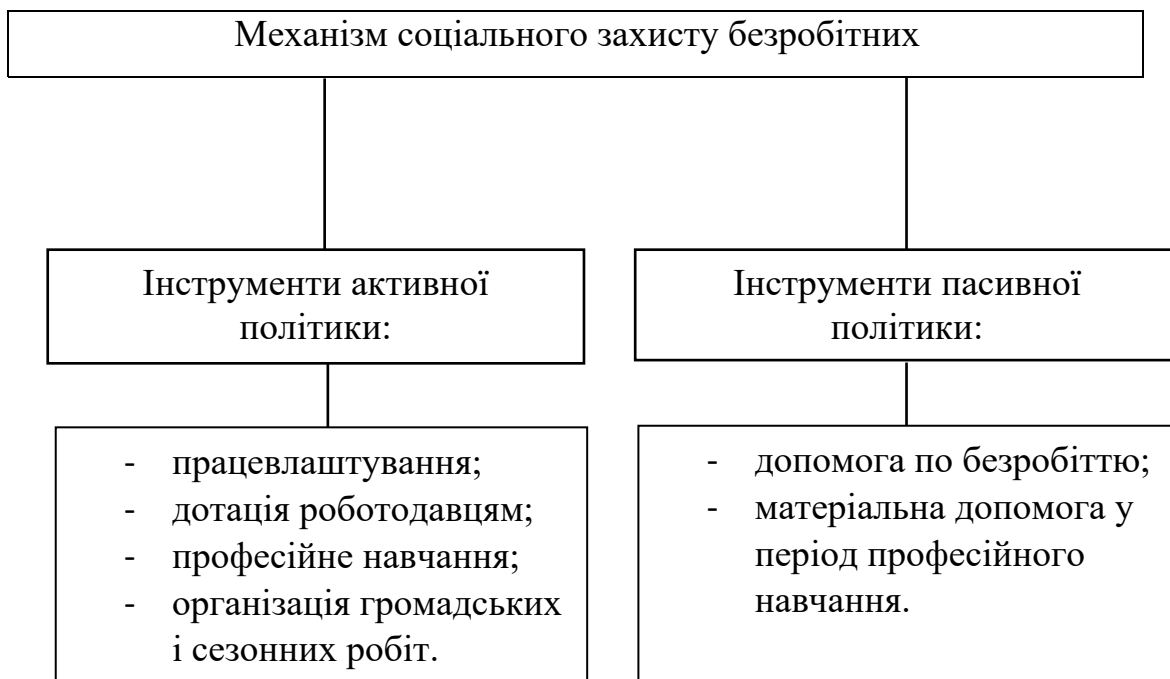
Рисунок 1.5 – Механізм соціального захисту безробітних в Україні [8]

Механізм соціального захисту людей, які втратили роботу в Україні є складним і включає як активні, так і пасивні інструменти політики, що наведено на рис. 1.5.